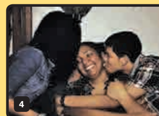
A pesar de ser un año tan duro, nosotros tenemos que darle gracias a Dios porque pudimos sobrevivir.