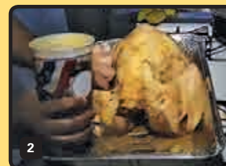
Aunque el tradicional pavo no podía faltar, en la mesa de esta familia habrá de todo un poco.